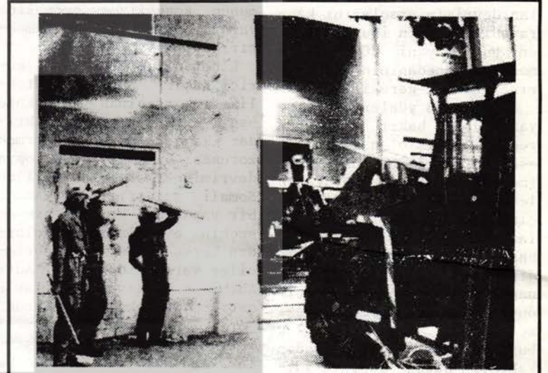
Polis B. Berlin'de ev işgalcilerine böyle saldırdı.

rış Konser'ine 60.000 kişinin katılımı, sendikalar tarafından 1 Eylül'de düzenlenen savaş aleyhtarı eylemler ve son olarak ABD dışişleri bakanı Haig'in B. Berlin'i ziyareti nedeniyle NATO'nun silahlanma politikasına karşı düzenlenen ve 80.000 kişinin katıldığı yürüyüş Senato'yu ve gerici güçleri panik içine düşürmüştür.