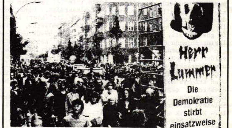
GEW B. Berlin örgütünün çağrısı üzerine aynı gün on bin kişi Oliver Platz'da Rattay'ın ölümüne neden olan polisi ve İçişleri Senatörü Lummer'i kınadı.