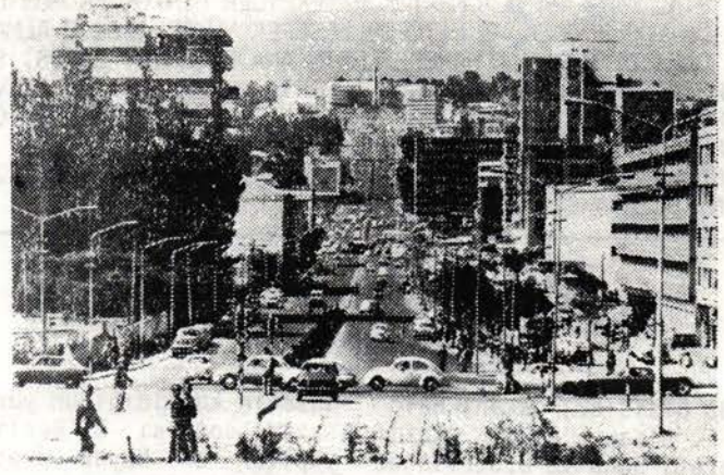
Adis Abeba'dan bir görünüş.

1975 başlarında öğrenciler, üniversiteliler, öğretmenler ve askerlerin köye akın seferi başladı. Bunlar halka devrim haberini duyurdular. Cehalet kararlığını